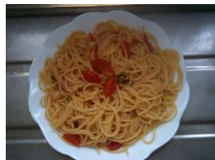
パスタにソースを吸わせてソースがほとんどなくなったら完成