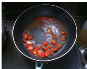
ソースはサイパン等で素早くかきまぜ作ります。