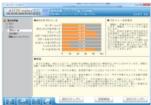
図 3 評価結果プロフィール画面

※サポステの登録方法を詳しく知りたい時は Tel 0229-21-7022 お電話ください。