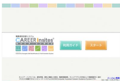
図 1 スタート画面

キャリア・インサイトは、利用者自身がコンピュータを使いながら、職業選択に役立つ適性評価、適性に合致した職業リストの参照、職業情報の検索、キャリアプランニングなどを実施できる総合的なキャリアガイダンスシステム（Computer Assisted Careers Guidance System）です。